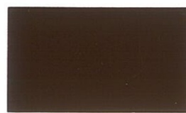
น้ำตาลเข้ม