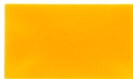
สีเหลือง