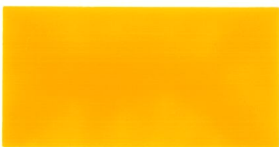
สีเหลือง