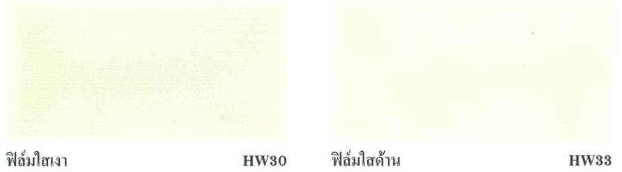
ฟิล์มใสเงา