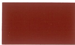
น้ำตาลแดง